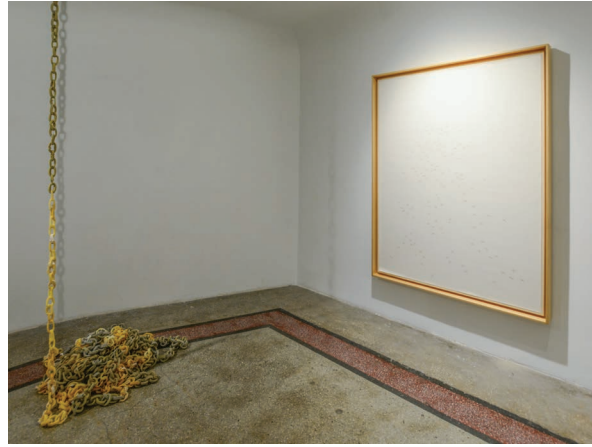
2 & 3

Çoğu zaman kapısını aralamaktan dahi korktuğumuz bilinmezlikler güvenli paylaşım alanları içinde ifade bulduğunda insanı eylemsiz bırakan ürkütücü gerçeklikler olmaktan çıkıyorlar. Sergi, bir aradalıktan beslenen, soru sormayı ve dinlemeyi merkeze alan bu paylaşım alanının tesis edildiği bir kolektif çalışmanın sonucu. Bu süreçte bilinmez boyutlarını anlamak üzere sorulan onlarca soru süzülerek "bilmesen ne olur?" sorusunu ortaya çıkardı. Sergi bilinmezlikleri ivedilikle çözülmesi gereken sorunlar değil öğrenme fırsatları olarak gören bir bakış açısıyla izleyiciye de kendi bilinmezliklerine bakabilme cesareti sunabilmeyi arzuluyor.