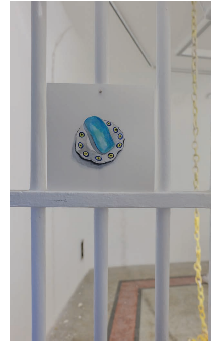
1 & 2