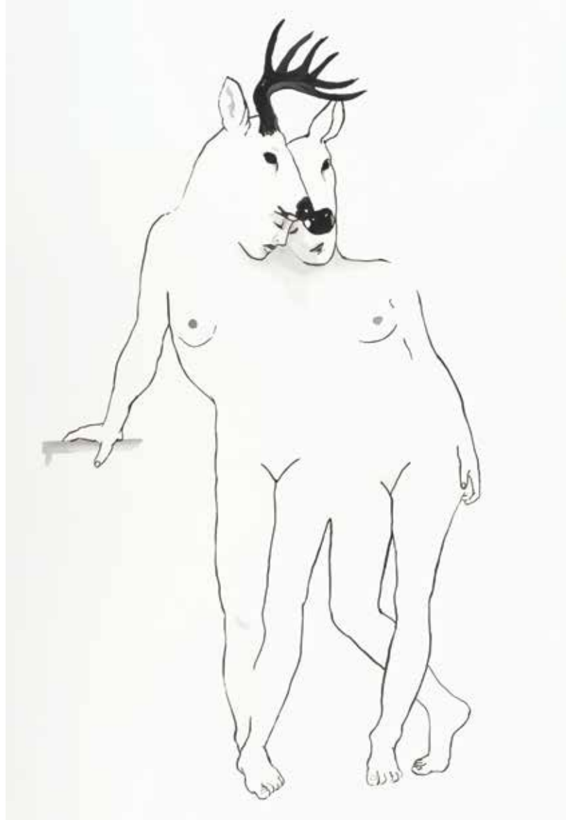
Necla Rüzgar Her Sayfada Adım Yazılıydı Dizisi 2021 Kâğıt üzerine mürekkep 76x56 cm

Ama bazı izleyiciler tümüyle bağımsız bir deneyim kurguluyor. Onlar imgeleri kendi içlerinde algılıyor ve kendi çağdaş perspektiflerinden hareketle okuyorlar. Müzenin mimarisi ve felsefesi her ikisine de izin veriyor.